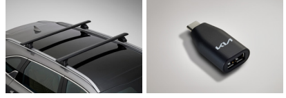
크로스바 C to USB-A 변환젠더