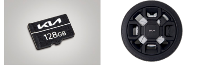
빌트인 캠 2 전용 SD카드(128GB) 휠 디자인 디퓨저